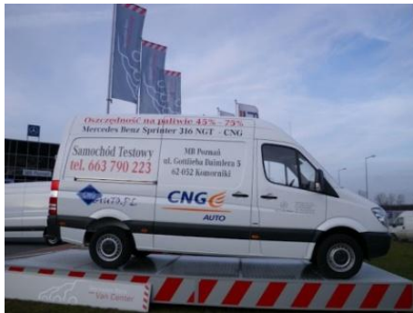
Fot. Mercedes Sprinter NGT