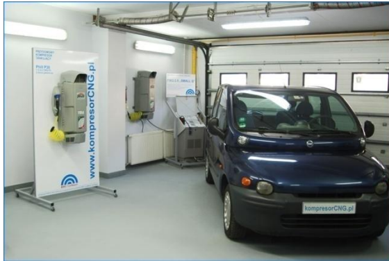
Fot. Kompresory CNG marki BRC FuelMaker