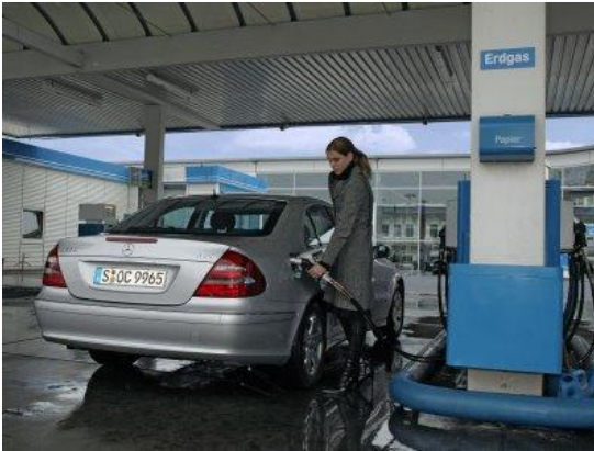
Fot. Tankowanie CNG w Niemczech