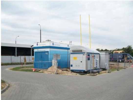
Fot. Modernizacja stacji CNG w Poznaniu