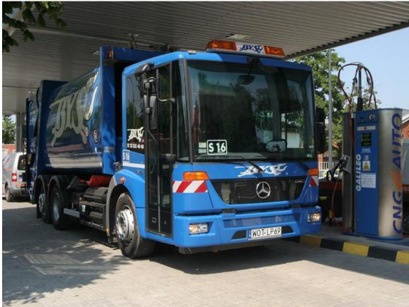
Fot. Mercedes Econic NGT (BYŚ)