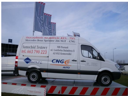
Fot. Modernizacja stacji CNG w Poznaniu