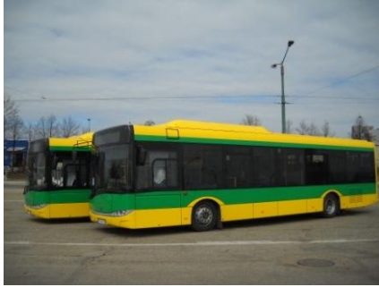
Fot. Solaris Urbino CNG