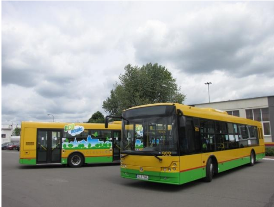
Fot. Solbus LNG podczas pokazów w MZA Warszawa