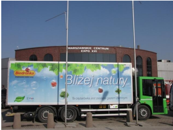
Fot. Mercedes Econic NGT