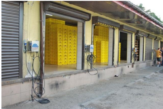
Fot. Zakładowa stacja CNG przy piekarni