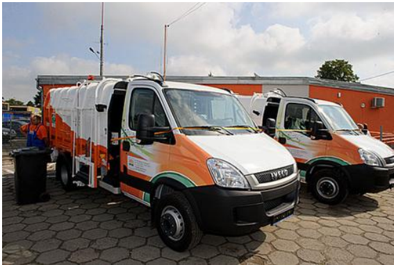
Fot. Iveco Daily CNG