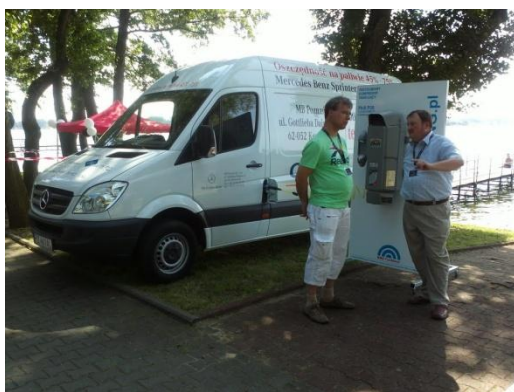
Fot. Przedstawienie Mercedes Sprintera od MB Poznań w Kiekrzu k/Poznania