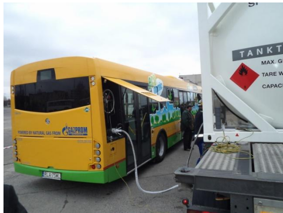
Fot. Tankowanie LNG z mobilnej stacji