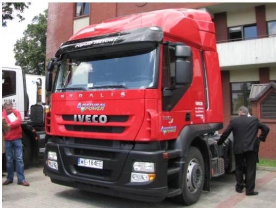
Fot. Iveco Stralis CNG