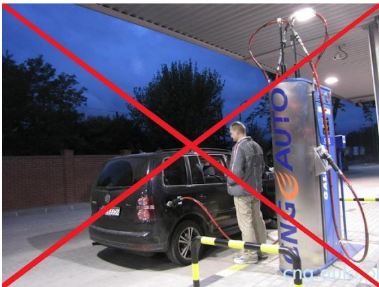
Fot. Tankowanie CNG w Polsce...

➤ Zablokowanie samoobsługowych stacji CNG (tankomaty)