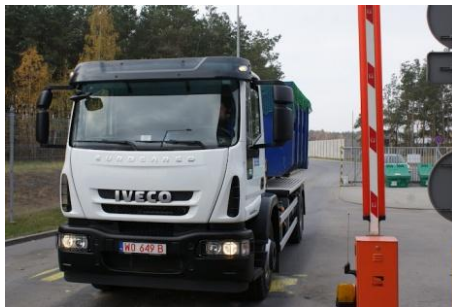
Fot. Iveco Eurocargo CNG