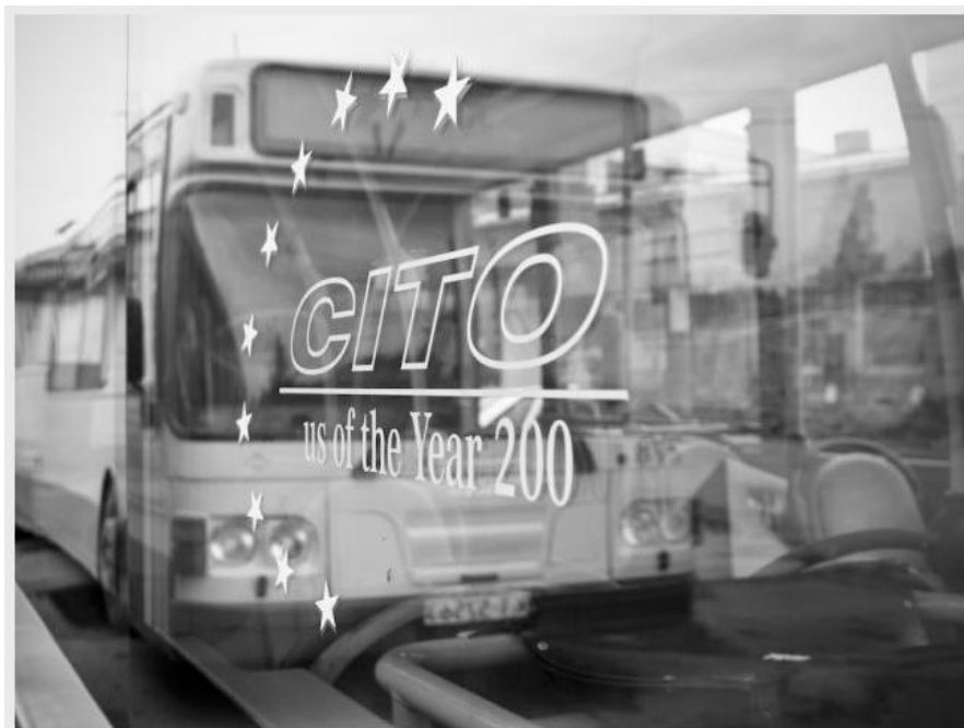
Volvo B10BLE CNG