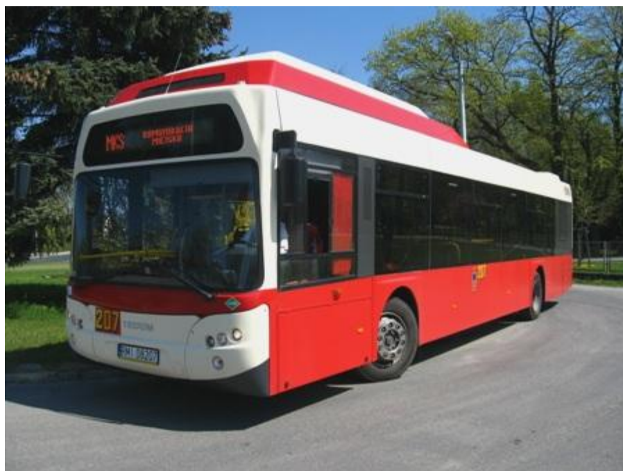
Tedom 123G CNG