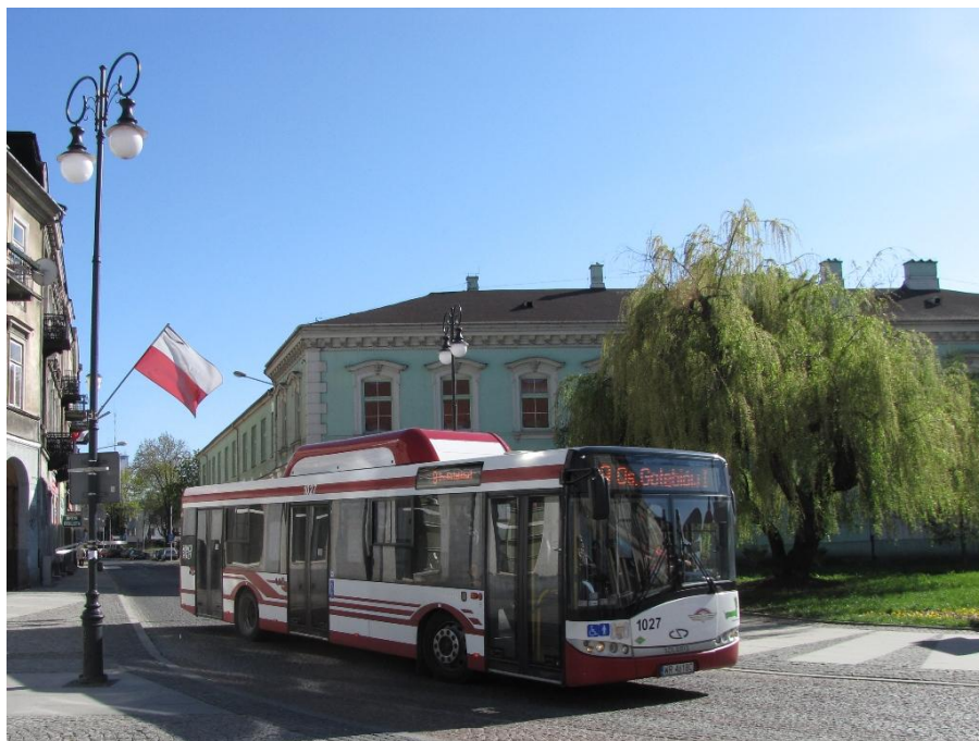
Solaris Urbino 12 CNG