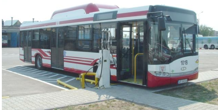
Solaris Urbino 12 CNG