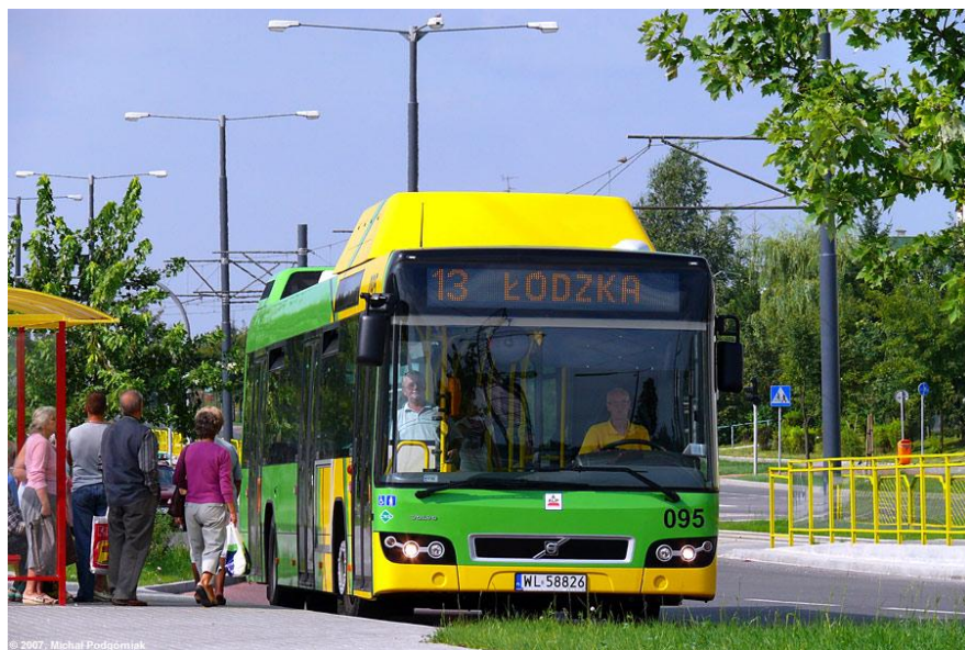
Volvo 7700 CNG