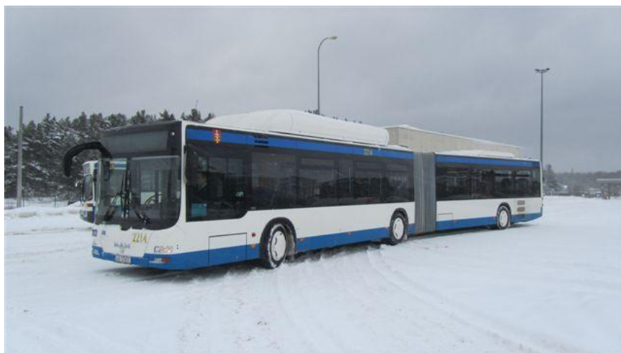
MAN Lion's City 18 CNG