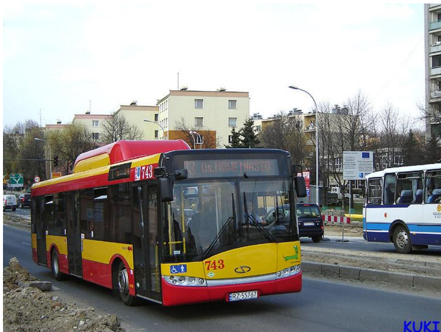
Solaris Urbino 12 CNG