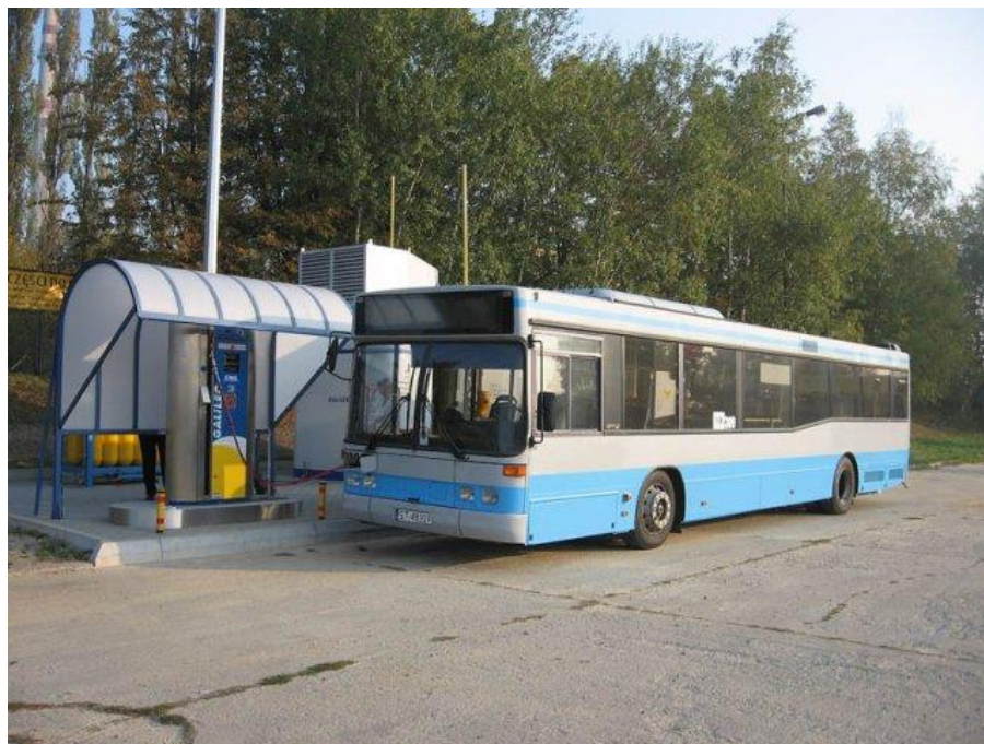
Volvo B10L CNG