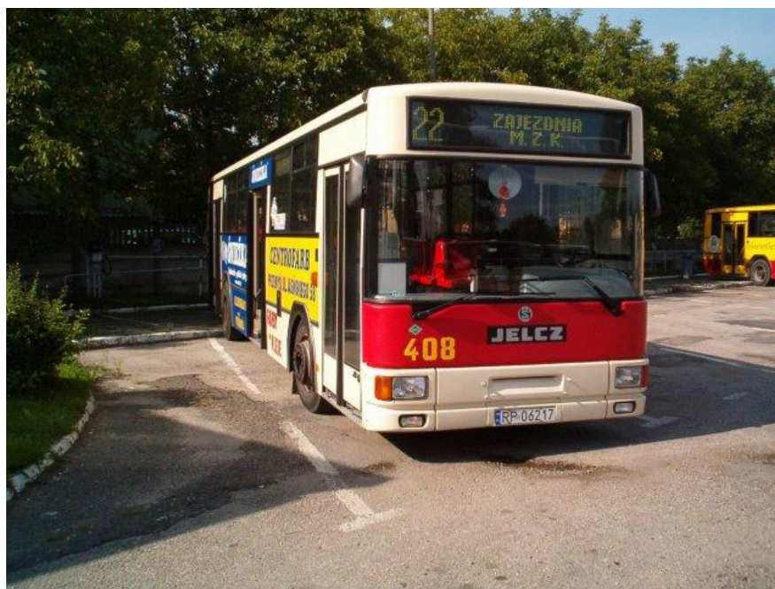
Jelcz 120M CNG